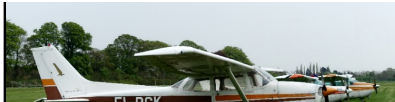
Cessna 赛斯纳 172