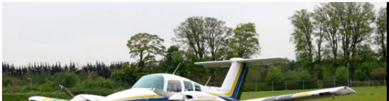
Beechcraft (比奇) 76